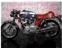
LA REGINA DEL SALONE La MV Agusta 750S col telaio rosso e la livrea blu listata di bianco del serbatoio