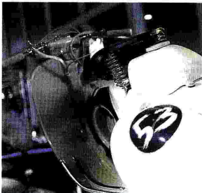
IL MITO DELLA LAMBRETTA INNOCENTI

Un dettaglio della Lambretta, lo scooter prodotto dalla Innocenti di Milano dal 1947 al 1972. Il nome deriva dal fiume Lambro, che scorre nel quartiere Lambrate, in cui sorgevano gli stabilimenti di produzione