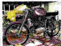
MASERATI A DUE RUOTE Un'immagine di una rara moto prodotta dalla Maserati, un piccolo gioiello degli anni '50