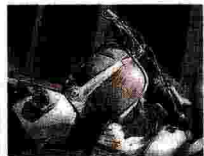
SEMPRE DI MODA DAL '46 La Vespa Piaggio fu brevettata il 23 aprile del 1946 dall'ingegnere aeronautico Corradino D'Ascanio