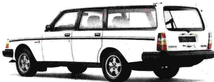
Le inconfondibili forme della Volvo 240 GLT