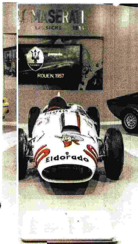
La Maserati Eldorado del 1958