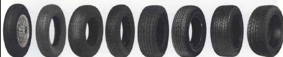
STELLA BIANCA CA67 CN72 CN36 N4 CN 12 P5 P7 N4 P700-Z