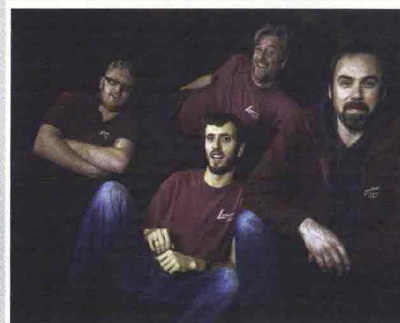
Si ringrazia per la consulenza la Longstone Classic Tyres ( longstonetyres.co.uk )