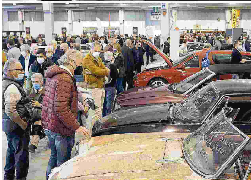
Nelle foto in alto le lunghe code alle biglietterie e il traffico di auto ieri mattina davanti alla fiera Al centro e sopra i tantissimi appassionati che hanno affollato i numerosi stand

Ritaglio stampa ad uso esclusivo del destinatario, non riproducibile.