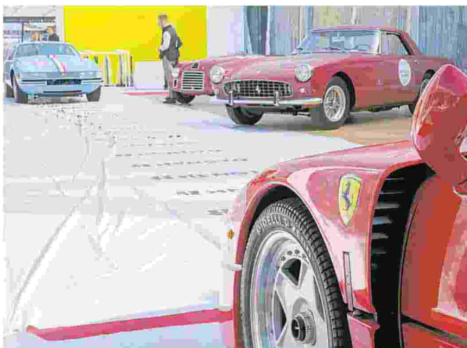
LA MOSTRA DELLE FERRARI CLASSICHE CON I GIOIELLI DEL MUSEO DI MODENA

Veloce Classic and Sport Cars London espone un rarissimo Lancia Superjolly che ospitò Papa Paolo VI e Giovanni Paolo II