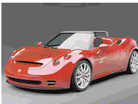
SVELATA LA ABARTH CLASSICHE 1000 SP PRODOTTA IN SERIE LIMITATISSIMA DI 5 ESEMPLARI

Ferruccio Lamborghini al Salone di Torino del 1963 presentò la GTV, dal cui prototipo nacque la prima auto con lo storico marchio