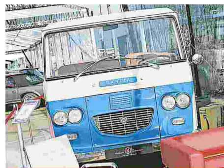
LA LANCIA SUPERJOLLY IN ALLESTIMENTO "PARATA" CHE OSPITÒ DUE PAPI E LA PRINCIPESSA GRACE