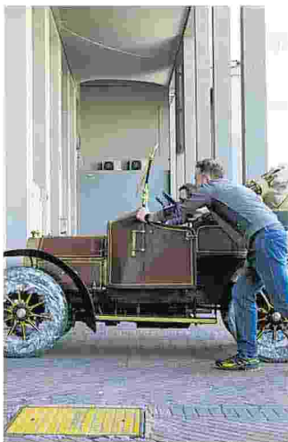
Ieri l'allestimento della fiera