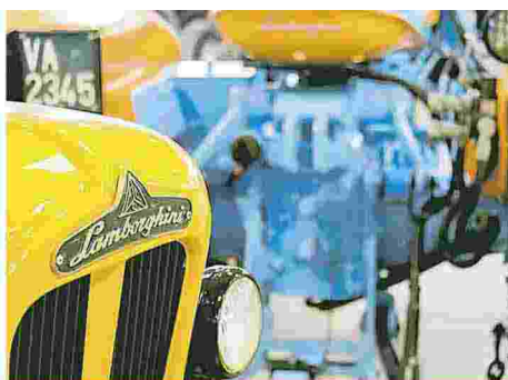
LAMBORGHINI 350 GT COUPÉ TOURING SUPERLEGGERA LA PRIMA VETTURA DI UN MARCHIO MITICO

toria di Sandro Munari al rally di Montecarlo del 1972: allo stand di Acì Storico sarà esposta proprio la protagonista, la Lancia Fulvia HF 1600 numero 14. E poi sempre dalla Lancia ci sarà un Superjolly in allestimento "parata" per scopi promozionali: ha trasportato la Principessa Grace, Gianni Agnelli e ben due pontefici: Paolo VI e Giovanni Paolo II.