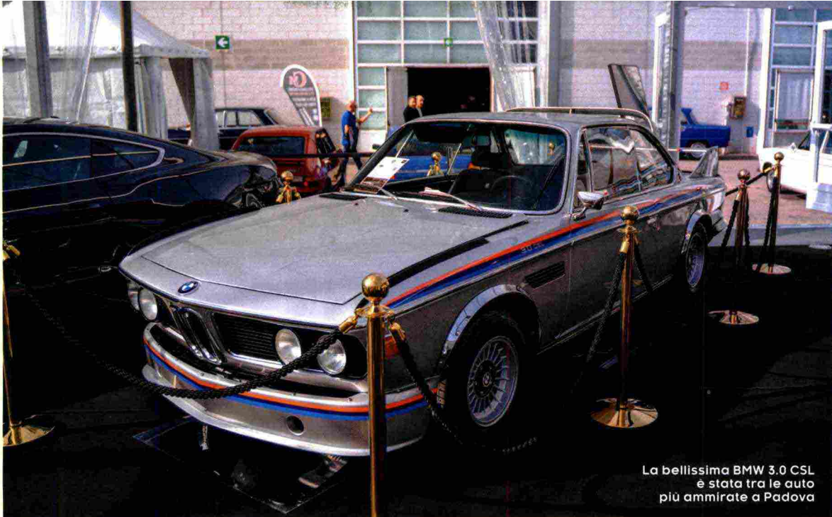
La bellissima BMW 3.0 CSL è stata tra le auto più ammirate a Padova

1947, mossa dal V12 da 118 cavalli, ovvero la prima macchina con il marchio del Cavallino, nonché la prima Ferrari da competizione. E poi la Ferrari 750 Monza del 1954, la 365 GTB4 Daytona 1968, la 250 GT Coupé del 1958, la Dino 246 GTS del 1969 e, infine, la F40 del 1987 e, cioè, la Ferrari nata per celebrare i primi 40 anni della casa di Maranello.