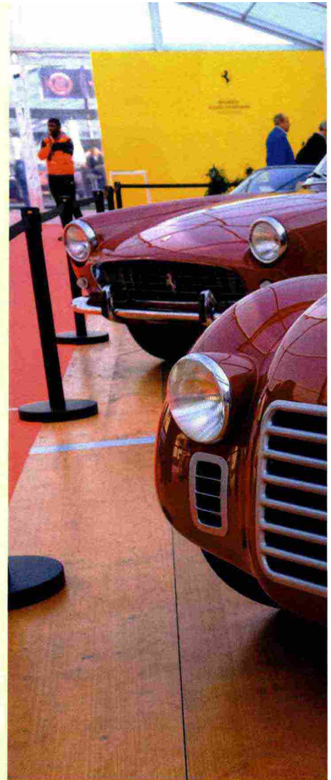
Per l'edizione 2022 l'organizzatore ha allestito diverse mostre tematiche assieme a Mercedes, Alfa Romeo e Ferrari