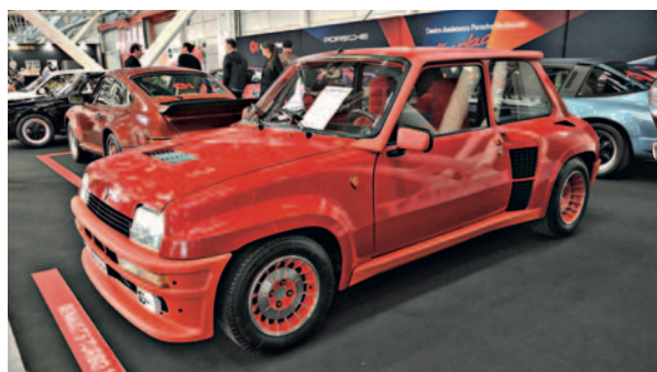
↑ Renault 5 Turbo 1

Francuska kompanija Delage izaziva konkurenciju. Englez Eldridž uverava Fijat da prihvati izazov. „Mefistofele“ je automobil sa avionskim motorom A12 Bis, istim onim koji je 1916. godine oborio rekord u visini leta, a 1924. postavlja novi rekord u brzini na zemlji. Međutim, automobil biva diskvalifikovan jer nema stepen prenosa za vožnju unazad. Eldridž ostaje pribran, unapređuje menjač, ponovo se takmiči i postavlja novi rekord od 234,98 km/h.