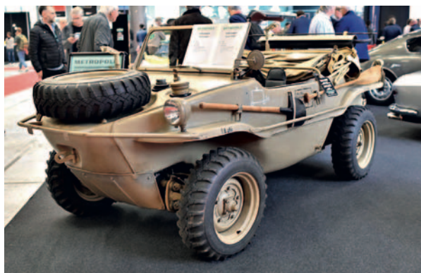
↑ VW Schwimmwagen, amfibijsko vozilo nemačke vojske sa pogonom na četiri točka, najmasovnije proizvedena amfibija